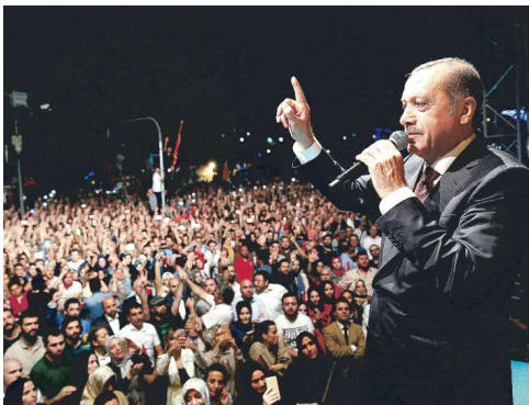
Ο πρόεδρος Ερντογάν μιλά στον τουρκικό λαό μετά την καταστολή του πραξικοπήματος.