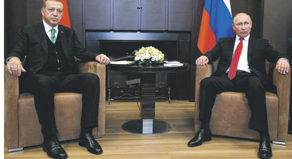
Ο πρόεδρος της Τουρκίας Ρετζέπ Ταγίπ Ερντογάν (αριστερά) κατά τη συνάντησή του με τον πρόεδρο της Ρωσίας Βλαντιμίρ Πούτιν.