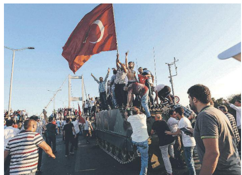
Τουρκίοι πολίτες πανηγυρίζουν για την καταστολή της απόπειρας στρατιωτικού πραξικοπήματος.

Η πρόσφατη πολιτική ζωή της σύγχρονης Τουρκίας στιγματίστηκε από την αντιπαράθεση της ισλαμικής και της κεμαλικής παράταξης. Μετά την απόπειρα πραξικοπήματος του Ιουλίου 2016 η επικρατούσα ισλαμική παράταξη στο πλαίσιο επίτευξης των στόχων του Κόμματος Δικαιοσύνης και Ανάπτυξης (ΚΔΑ) [κόμμα του Τ. Ερντογάν] για την "ισλαμοποίηση" του κοινωνικού και πολιτικού γίγνεσθαι της χώρας επιδόθηκε σε διώξεις των στρατιωτικών και πολιτικών εκπροσώπων της κεμαλικής.