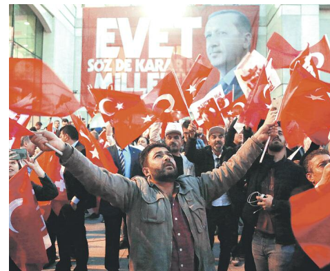
Συγκέντρωση οπαδών του «ναι» στο δημοψήφισμα της 16ης Μαΐου 2017.

σία του κόμματος εκοτράτευσε υπέρ του «ναι», όμως τα μέλη της εσωκομματικής αντιπολίτευσης διακόρισαν τη θέση τους, στάση που επηρέασε τη συμπεριφορά των ακροδεξιών ψηφοφόρων στην κάλπη. Μολονότι οι συνθήκες υπό τις οποίες διεξήχθησαν οι δύο εκστρατείες ήταν άνισες, μιας και οι αρχές έθεσαν ανυ-