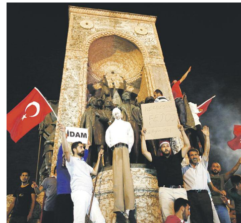
Υποστηρικτές του προέδρου Ερντογάν «απαγορίζουν» ομοίωμα του ιμάμη Γκιουλέν.