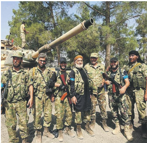
Σύριο αντικαθεστωτικό με Τουρκομάχους στην επιχείρηση κατάληψης της Τζεφμπίλους. Πίσω διακρίνεται τουρκικό όπλο.

περιοχή της Συρίας και του Ιράκ «πεδίο αντιπαράθεσης» για την εξασφάλιση του ελέγχου της περιοχής. Κάθε νέο κενό ισχύος στην περιοχή αποτελεί για αυτές έναυσμα εμπλοκής, συνήθως με αντικρουόμενα συμφέροντα, με αποτέλεσμα να μετατρέπουν την κάθε ευ-